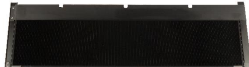
Soltech ShingEl Solcellepanel – svarer til 5 stk. Benders Carisma.

Brillant-Sort - En unik overfladebehandling med et metalbaseret pigment, som gør tagstenen specielt smuk sammen med Soltech ShingEl solpaneler, og desuden styrker tagstenen yderligere, for at give den en yderligere forlænget levetid.